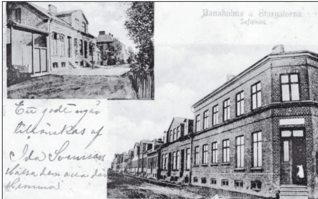
Vykort över Banaholms- och Storgatorna från omkring 1901. Banaholmsgatan är nuvarande Nobelvägen och Storgatan är nuvarande Idungsgatan

Liksom i staden orsakade avlopps- och avfallsfrågorna problem för Sofielunds invånare. Detta kom senare att avhjälpas, då gatorna förbättrades och stensattes. Den belysning man hade i hemmen bestod till en