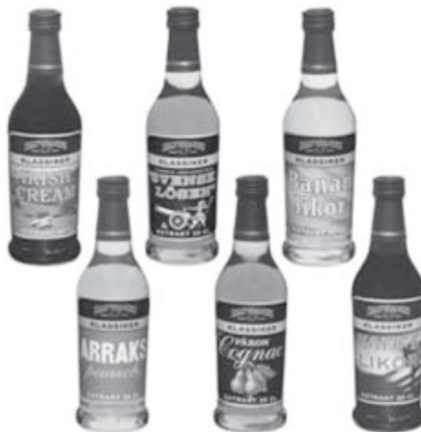
Saturnus tillverkade bland annat likörextrakt

Under 1970-80-talet förändrades industristrukturen och de ekonomiska förutsättningarna för företagande, vilket resulterade i att ett flertal företag lämnade Sofielunds industriområde. Exempel på företag som försvunnit från Sofielund är Metzéns kemtvätter (nerlagt), Malmö Kvarnmaskiner (idag Kamas i Västra Ingelstad), Wojidkow & Co (idag nedlagt), Saturnus (idag på Bronsxygegatan i Fosie), PLM (numera Rexam i Fosie), Malmö Lakritsfabrik/Malaco (idag Malaco/Leaf på Brogatan men med tillverkningen i bland annat Danmark), textilföretag som Malte Hulténs Skinnklädesfabrik, CeWo-kappor, Textilkonst och Masterhand (idag nerlagda). Märkligt nog har en slipsfabrik överlevt och har nu sin verksamhet i Sofielund. Pågens är tillsammans med Stadex idag områdets största industrietableringar