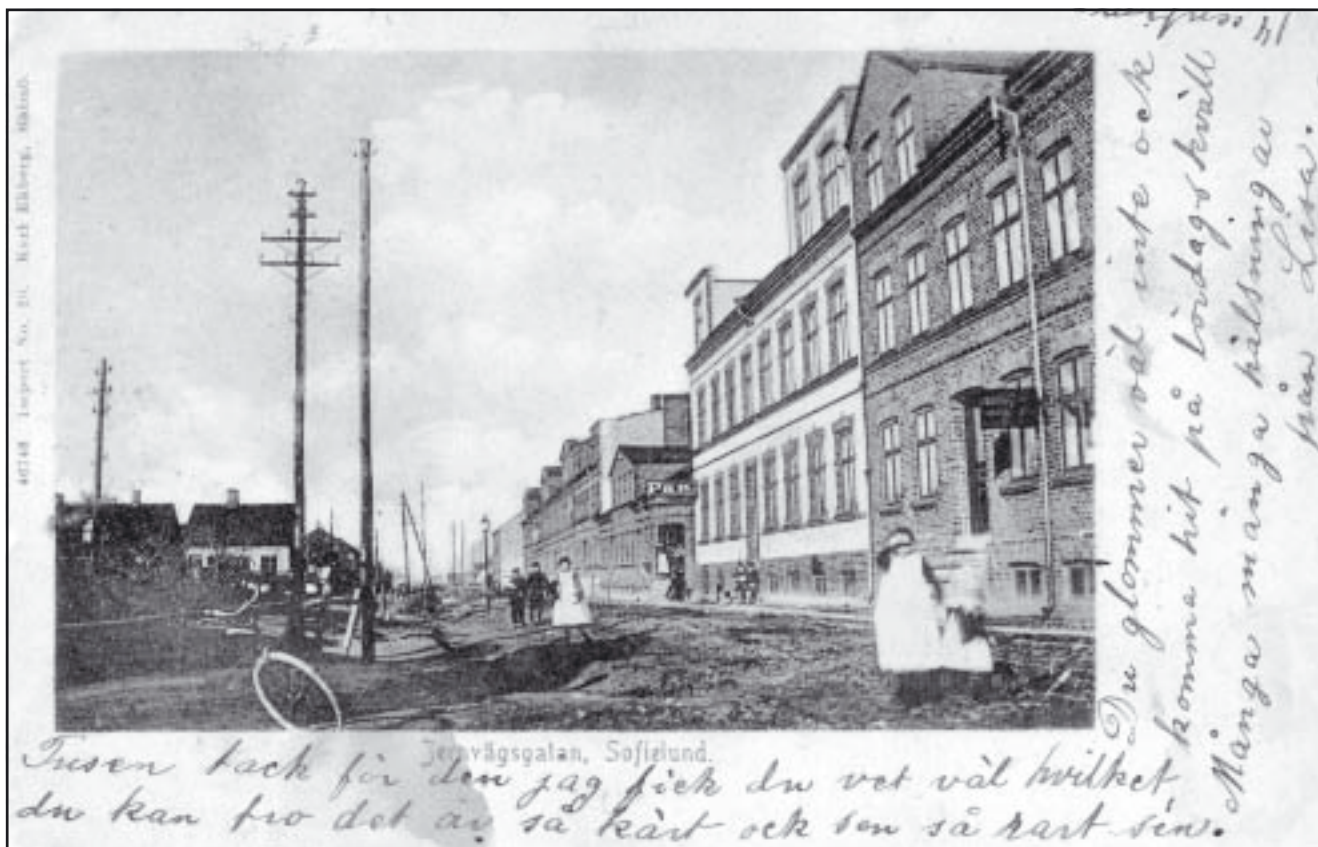
Vykort över Lönngatan (då Järnvägsgatan) mot väster från omkring 1901.

bostadsområde med småhusbebyggelse inom Sofielund. Området kom att benämnas »Sofielundshusen« och omfatta både Norra och Södra Sofielund. 1894 upprättades inofficiella tomtstyckningsplaner.