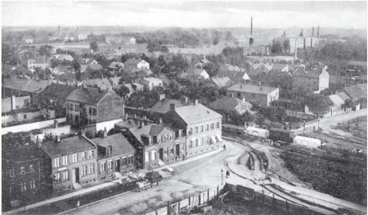
Utsikt mot öster över Södra Sofielund från vattentornet omkring 1910. I förgrunden järnvägen och i bakgrunden industrierna vid Bragegatan och Ystadvägen.