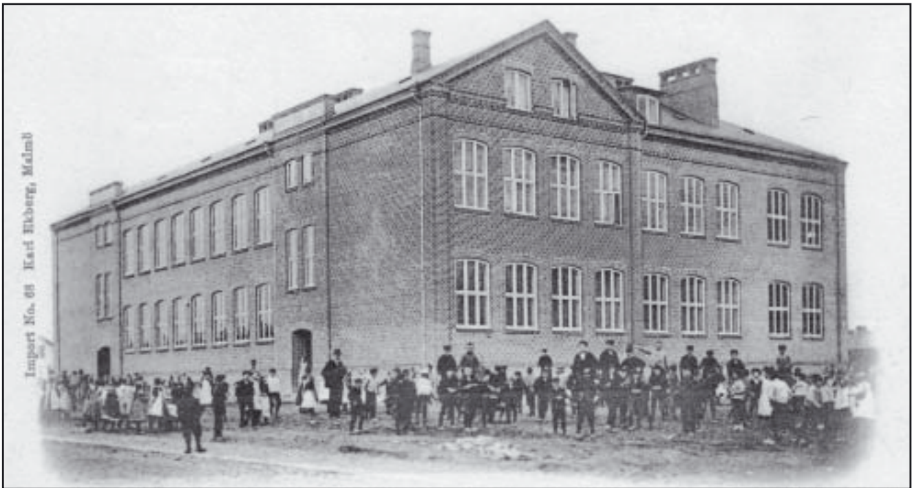
Vykort över Sofielunds skola från omkring 1902.

Skolverksamheten i den gamla byggnaden fortgick till 1982. Mot slutet blev användningen av byggnaden mer begränsad då den började förfalla allt mer och huset var då i princip rivningsförklarat. Efter ungdomskravaller 1983 fick musikföreningen Dundret efter överenskommelse med kommunens politiker tillgång till huset. Med politikernas stöd började föreningen med enkla medel förändra huset till en levande mötesplats för musiker, ungdomar och olika aktiviteter. Verksamheten ökade och kom slutligen att omfatta mer än 45 musikgrupper som övade en mängd olika musikstilar. En fotostudio byggdes och en cykelverkstad fanns redan i husets lokaler. Denna verkstad blev mötesplats för mc-entusiaster med speciellt intresse för amerikanska motorcyklar. 1993 ställdes Dundret inför ett ultimatum. Antingen bli vräkta eller flytta till nyinrättade Kajplats 305; huset skulle rivas.