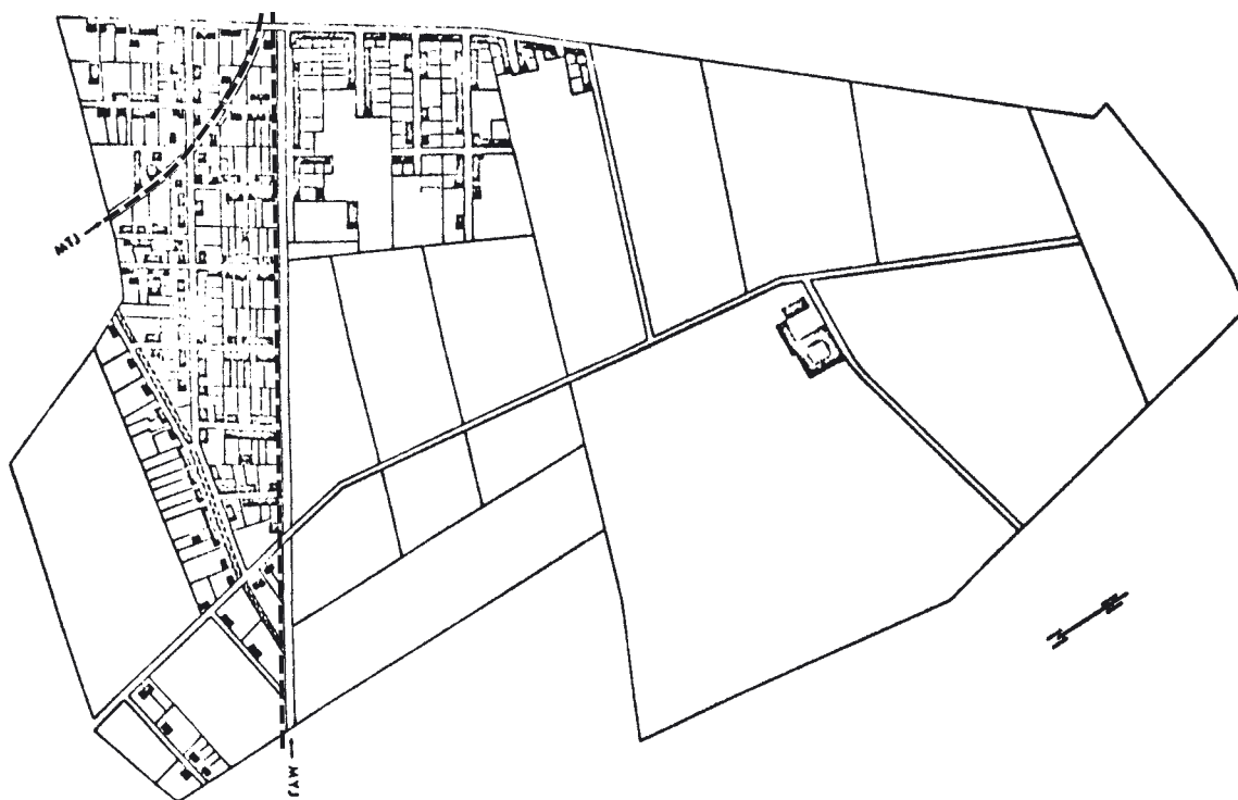
Bebyggelsen inom Sofielund enligt stadsplaneförslag upptättat av Nils Appelgren år 1900.

Detta var början till ett sammanhängande