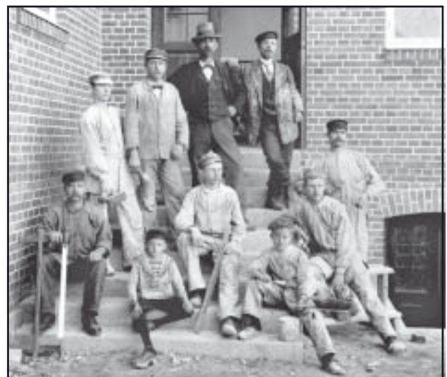
Hantverkare vid skolbygget 1902.