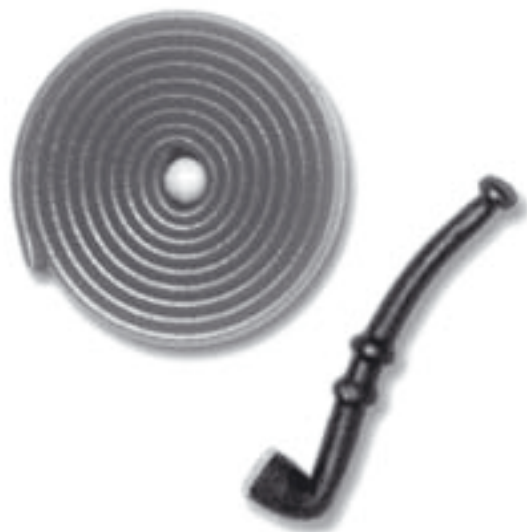
Malaco/Leaf tillverkade godis under många år på Sofielund.

Främst var det företag som växt fram i Malmös centrum och behövde större sammanhängande tillverkningsytor och lager som etablerade sig i Sofielund. Malmö kommuns framsynta stöd för att åstadkomma ett företagervänligt klimat i området resulterade i många intressanta företagsetableringar. Åkerlund & Rausing är emellertid ett undantag där Malmö kommun misslyckades att behålla ett expanderande företag. Åkerlund & Rausing, som 1937 behövde flytta från sina trånga lokaler vid Östergatan, försökte få Malmö stad att underlätta uppförandet av en ny fabrik i Malmö. Företaget flyttade istället till Lund när Lunds stad utan ersättning ställde mark till förfogande.