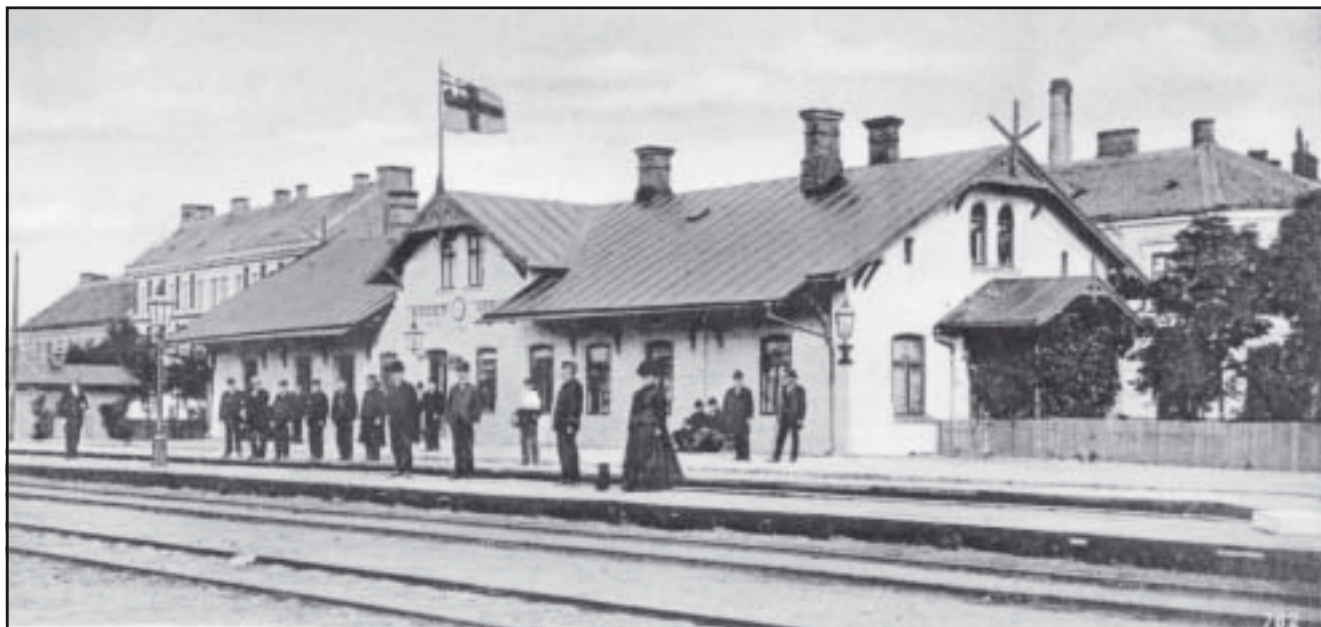
Vykort över Södervärns station från omkring 1902.