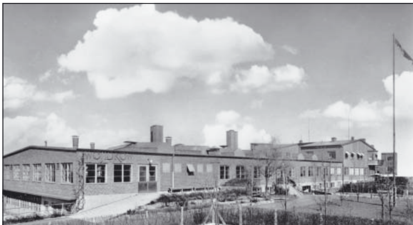
AB Wojidkow & Co, metallgjuteri, mekanisk verkstad och ytbehandling. Norra Grängesbergsgatan 11.

I samband med Kockums nerläggning under 1980-talets början och nerläggningen av alla Malmös större textilindustrier försvann också en mängd underleverantörer som servade dessa: gjuterier, grossister, verkstäder, snickerier och olika serviceföretag.