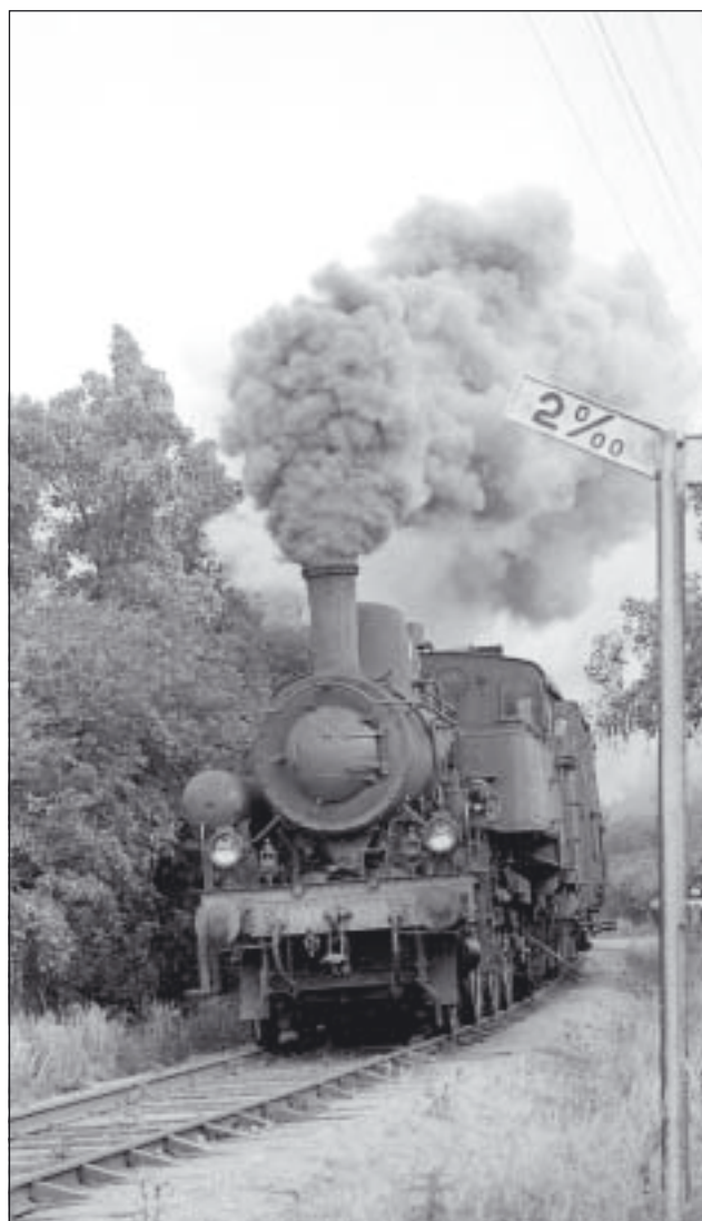
Badtåget på Falsterbobanan var Sveriges sista ordinarie ångtåg.