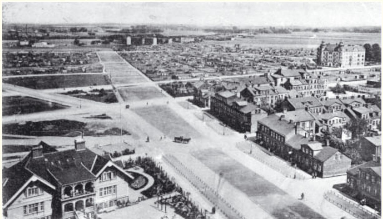
Utsikt mot öster över Norra Sofielund från vattentornet omkring 1910. Nobelvägen (då Banaholmsgatan) är bara delvis utlagd.