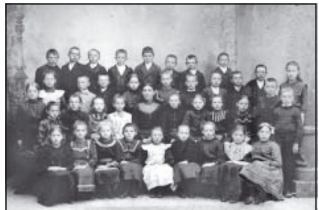
Sofielunds Folkskolas första klass 1902.

Att huset, som idag inrymmer Folkets Hus/Sofielund, inte revs vet vi idag och en ny epok för huset kunde inledas. När rivningsbeslutet togs engagerade sig de boende i Sofielund mot rivningsbeslut och för husets överlevnad.